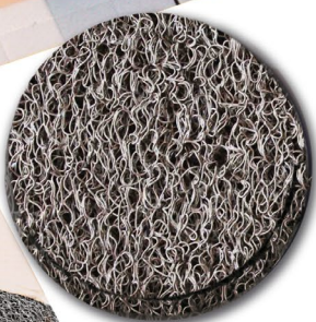
Nr. 6000 grey