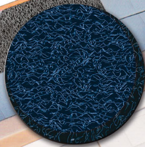
Nr. 6009 blue