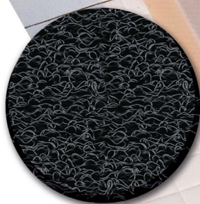
Nr. 6003 black