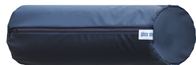
Bezug Nackenrolle erhältlich Art.Nr.5821

Maße..... ca.15 x 40,5 cm außen..... GISATEX® DRYWEAVE® 8mm Füllung..... GISATEX® DRYWEAVE® 20mm Stauchhärte..... flexibel, von weich bis fest