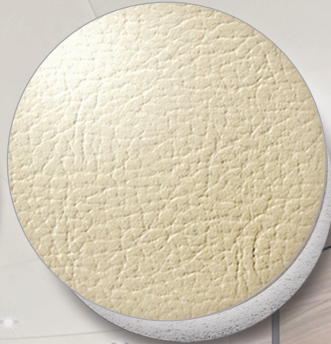
Nr. 0165 VK sand