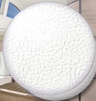
Nr. 0110 VK white