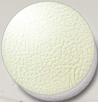
Nr. 0100 VK ivory