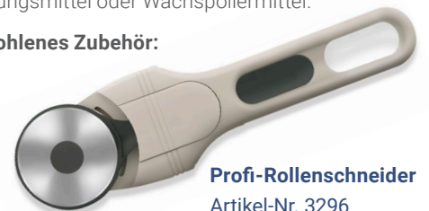
Profi-Rollenschneider Artikel-Nr. 3296