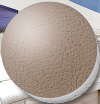
Nr. 0140 VK taupe