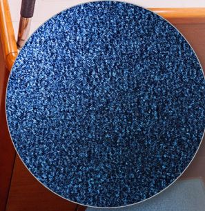
Nr. 304 navy blue