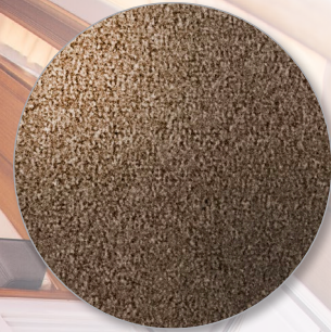
Nr. 802 sand