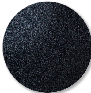
Nr. 902 anthrazit