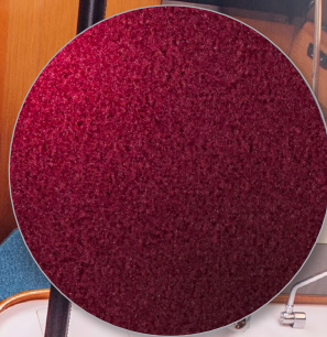
Nr. 101 bordeaux