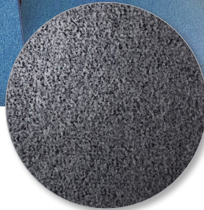
Nr. 508 grey