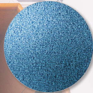
Nr. 305 delft blau